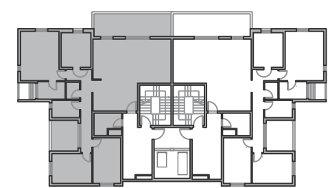
בנין 1 | קומה 12 | דירה: 46